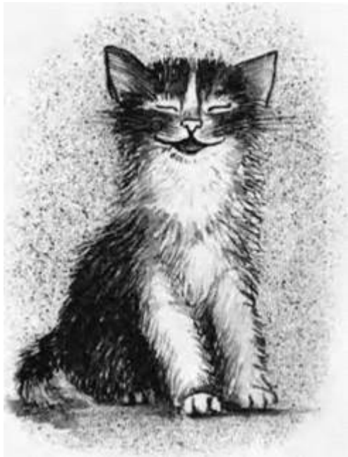
Малюнки Наталі Шишковської